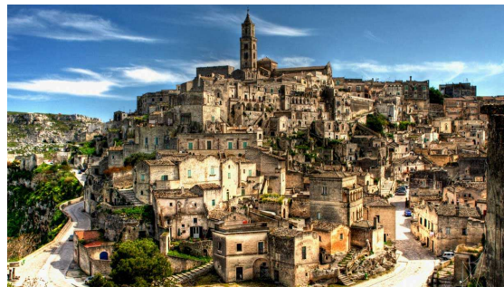
I Sassi di Matera