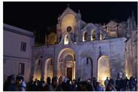
Chiesa di San Giovanni Battista