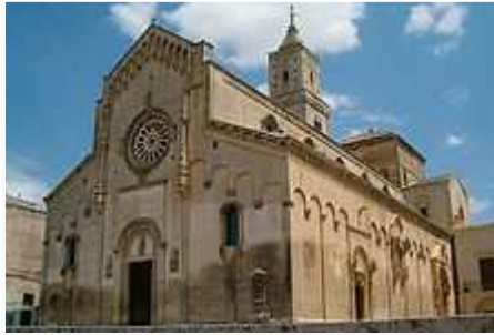
La cattedrale di Matera