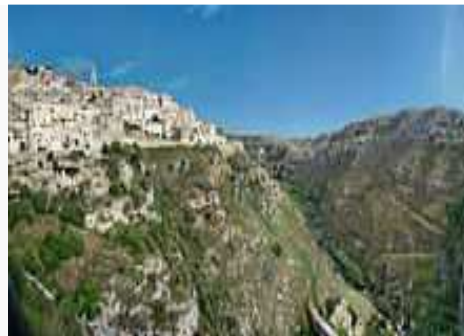
Parco della Murgia Materana