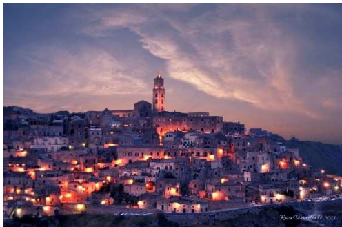
I Sassi di Matera

I Sassi di Matera sono un insediamento urbano derivante dalle varie forme di civilizzazione ed antropizzazione succedutesi nel tempo. Da quelle preistoriche dei villaggi trincerati del periodo neolitico che costituiscono uno dei nuclei abitativi più antichi al mondo, all'habitat della civiltà rupestre (IX-XI secolo), che costituisce il sostrato urbanistico dei Sassi, con i suoi camminamenti, canalizzazioni, cisterne; dalla civitas di matrice occidentale normanno-sveva (XI-XIII secolo), con le sue fortificazioni, alle successive espansioni rinascimentali (XV-XVI secolo) e sistemazioni urbane barocche (XVII-XVIII secolo).