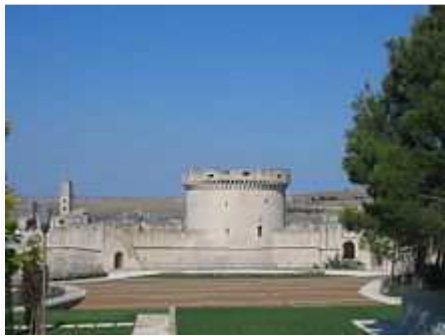
Il Castello Tramontano